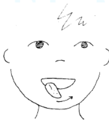
"Relamer" el labio inferior.