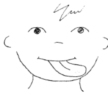
Lengua bien a la izquierda.

2º Relamer con la lengua alrededor de la boca (has comido un helado y debes limpiarte)