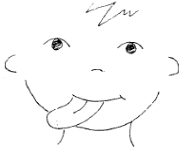
Lengua bien a la derecha.

1º Mover la lengua a un lado y a otro rápidamente sin mover la mandíbula (como una serpiente)