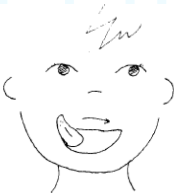
"Relamer" el labio superior.

2º Relamer con la lengua alrededor de la boca (has comido un helado y debes limpiarte)