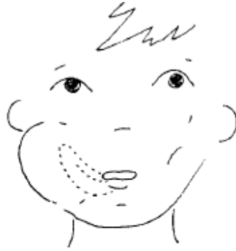
"Caramelo" a la derecha (con la lengua).