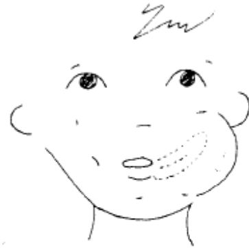
"Caramelo" a la izquierda con la lengua presionando.

Repetir el ejercicio varias veces cada vez más deprisa